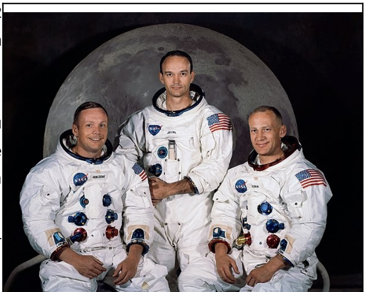
Figure 4: De gauche à droite Armstrong, Collins et Aldrin.