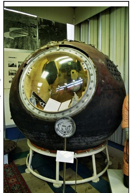
Figure 3: Module Vostok, wikipedia