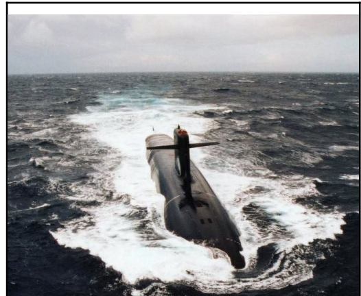
Figure 2: Le SNLE-NG Le Téméraire, de la Marine nationale française, wikipedia